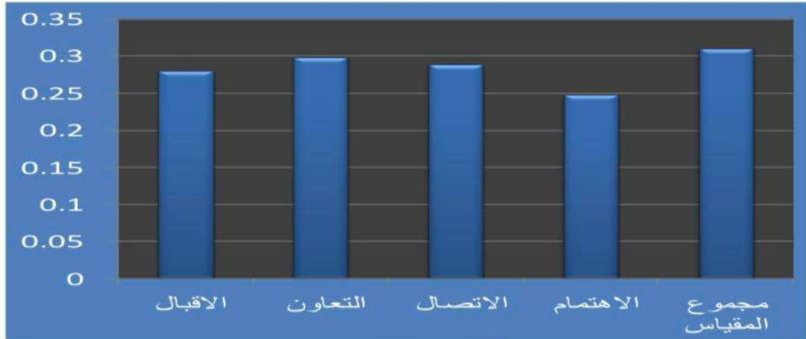
شكل (2) "معامل الارتباط بين مستوى التفاعل الاجتماعي والتنوع الثقافي لدى طلاب الجامعة من خارج فلسطين"